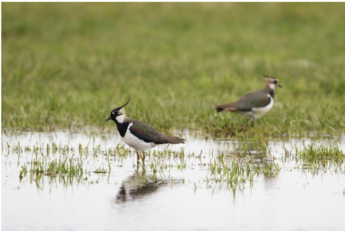
Kievit op plasdras

De vereenvoudiging van de regels door de Provincie heeft de mogelijkheid gegeven beter beheer af te sluiten. Het ruimer kunnen omgaan met de regels zorgt ervoor dat de goede dingen op de goede plaats gedaan kunnen worden.